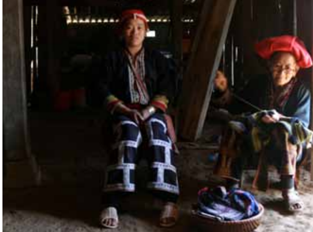
Artisanes à Sapa au nord du Vietnam

C'est lors d'un voyage initiatique en Asie du Sud-Est que la fondatrice réalise l'importance de l'artisanat pour l'amélioration des conditions de vie des femmes, et dans la transmission des savoir-faire. Alors que traditionnellement les enseignes font le design en France, et la production à l'étranger, elle décide de faire l'inverse. En utilisant les textiles originaux inchangés, le design sera donc étranger, et la production française.