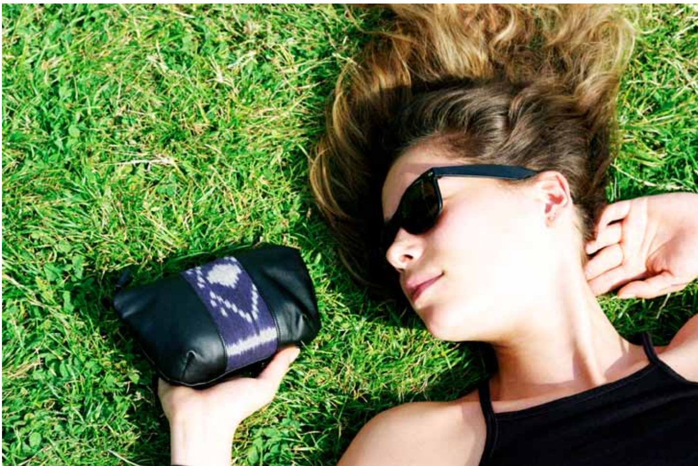
Trousse Diana Noir & Marine Psyché